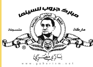
FREE EGYPT YOUTUBE CHANNEL

مقابلة: http://bit.ly/mNFV3 (globalvoicesonline.org)