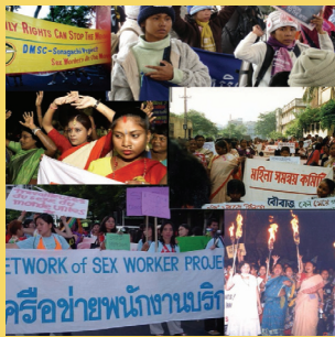
ASIA PACIFIC NETWORK OF SEX WORKERS