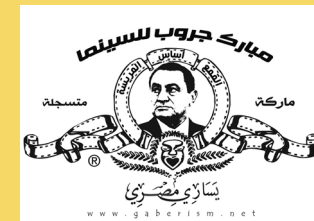
FREE EGYPT YOUTUBE CHANNEL

卢网： http://fromlu.net/ 访问： http://bit.ly/mNFV3 (globalvoicesonline.org)