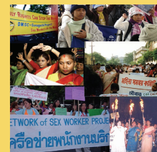
ASIA PACIFIC NETWORK OF SEX WORKERS