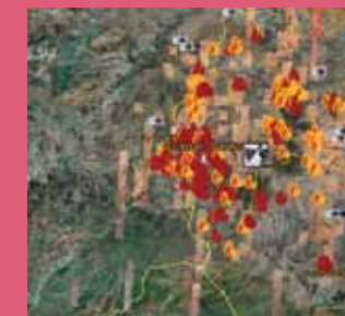
CRISIS IN DARFUR/GOOGLE EARTH