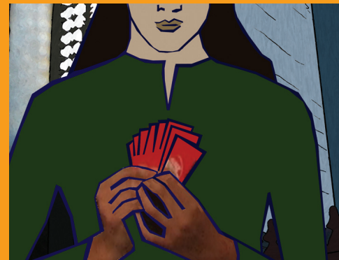
WOMEN AND MEMORY FORUM