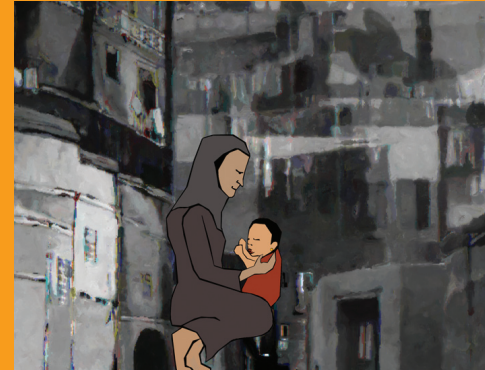
WOMEN AND MEMORY FORUM